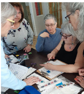
Cours de broderie