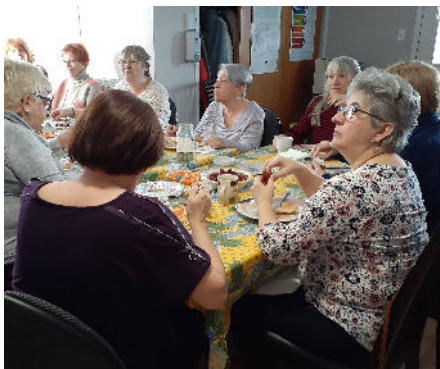
Assemblée de cuisine