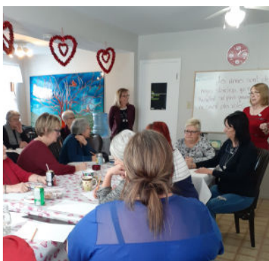
Assemblée de cuisine Spécial Saint Valentin