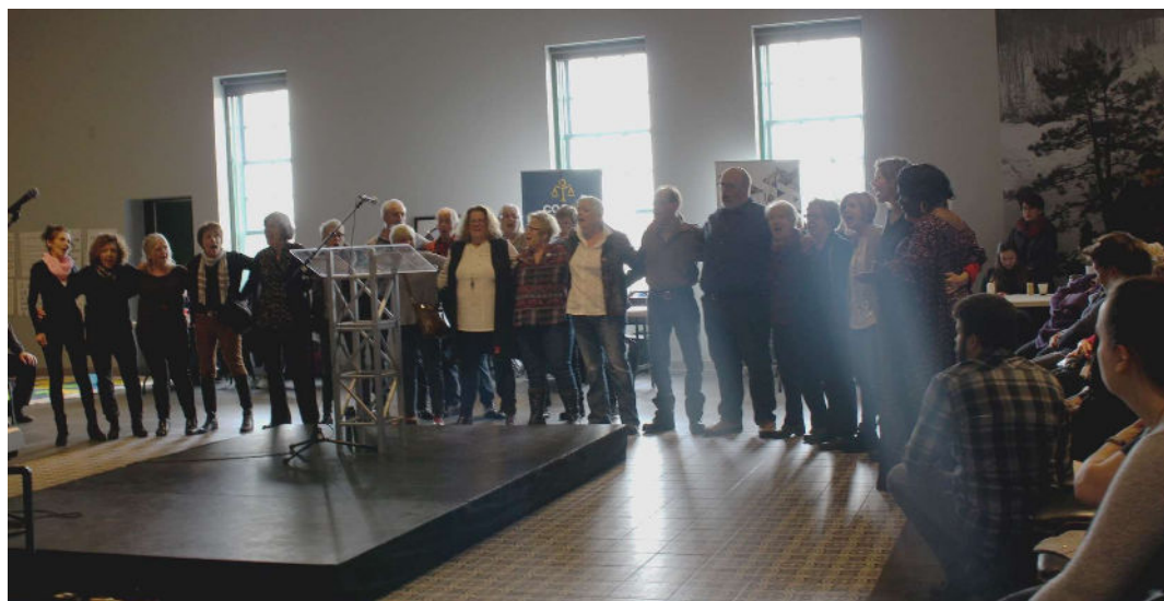
La Chorale Chant de l'Heure lors du 8 mars